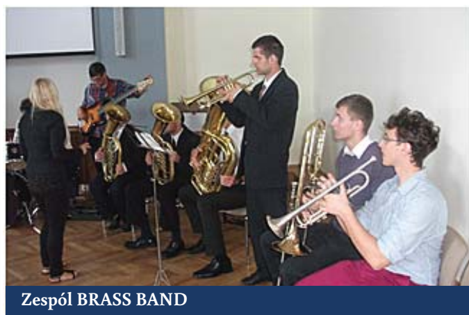
Zespół BRASS BAND