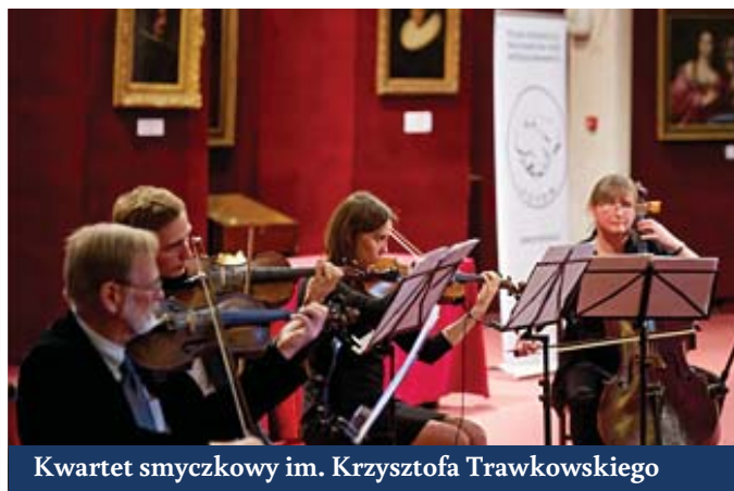
Kwartet smyczkowy im. Krzysztofa Trawkowskiego