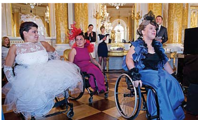
Pokaz mody projektantów Ewy i Piotra Krajewskich