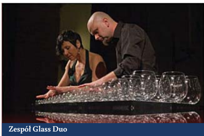
Zespół Glass Duo